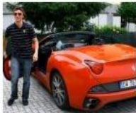
Per saperne di più.