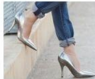
Soffri di alluce valgo?