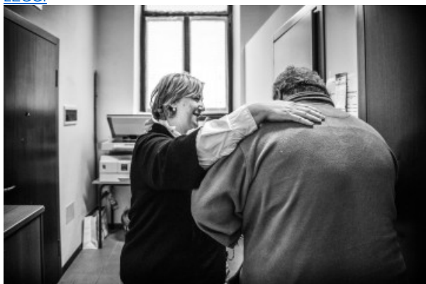
Benvenuti a casa vostra: nel torinese parte un nuovo progetto di social housing