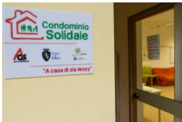
Housing sociale e solidarietà intergenerazionale: l'esperienza della Casa di zia Jessy