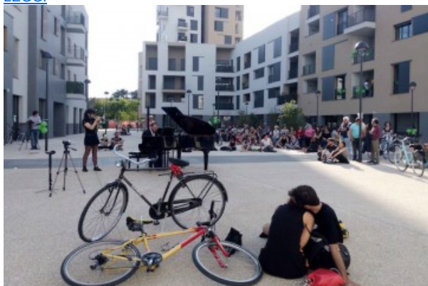
A Milano nasce Grace, un nuovo luogo pensato per le persone fragili. E non solo.