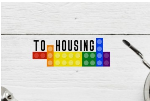
A Torino il primo social housing LGBT