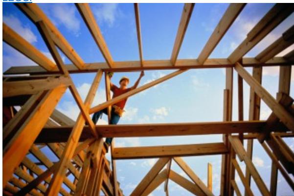
La condizione abitativa in Italia e in Europa